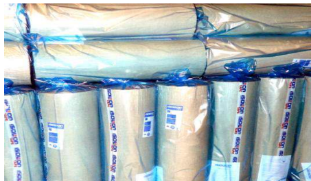
Isolontape 500 рулоны