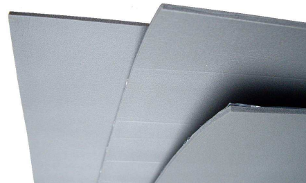
Isolontape 500 маты